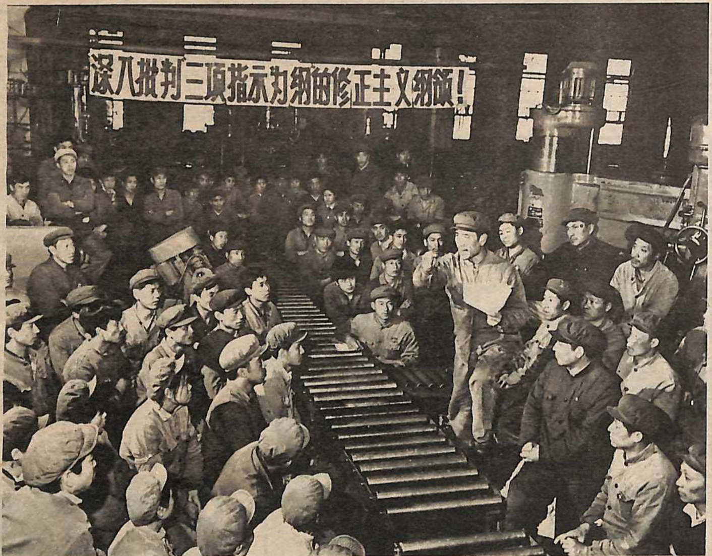
Abajo: Obreros de Shangai critican la formulación revisionista de "tomar las tres instrucciones como clave" durante la campaña para criticar a Deng y contragolpear el viento revocatorio derechista (1976).

cerebro de Lenin, se los aseguro. De hecho, al inicio, Lenin no tuvo nada que ver con los Soviets. Estos fueron formados espontáneamente por las masas (y algunos hasta fueron desarrollados por mencheviques reformistas y oportunistas). ¿Pero qué hizo Lenin? ¿Se puso a decir '¡pues al diablo con éstos, hombre, no es invención mía, así que no puede valer nada!'? No, él dijo que aquí estaba algo muy importante creado mediante la lucha de las masas, una forma de masas a través de la cual las masas mismas, y sus representantes políticos, pueden realmente tomar el control de la sociedad y empezar a traer al frente a millones y millones de personas para que en realidad administren