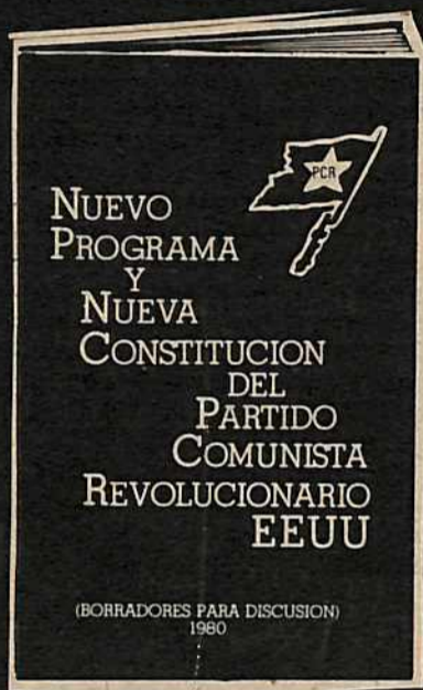
Nuevo Programa y Nueva Constitución del Partido Comunista Revolucionario EEUU (Borradores Para Discusión)