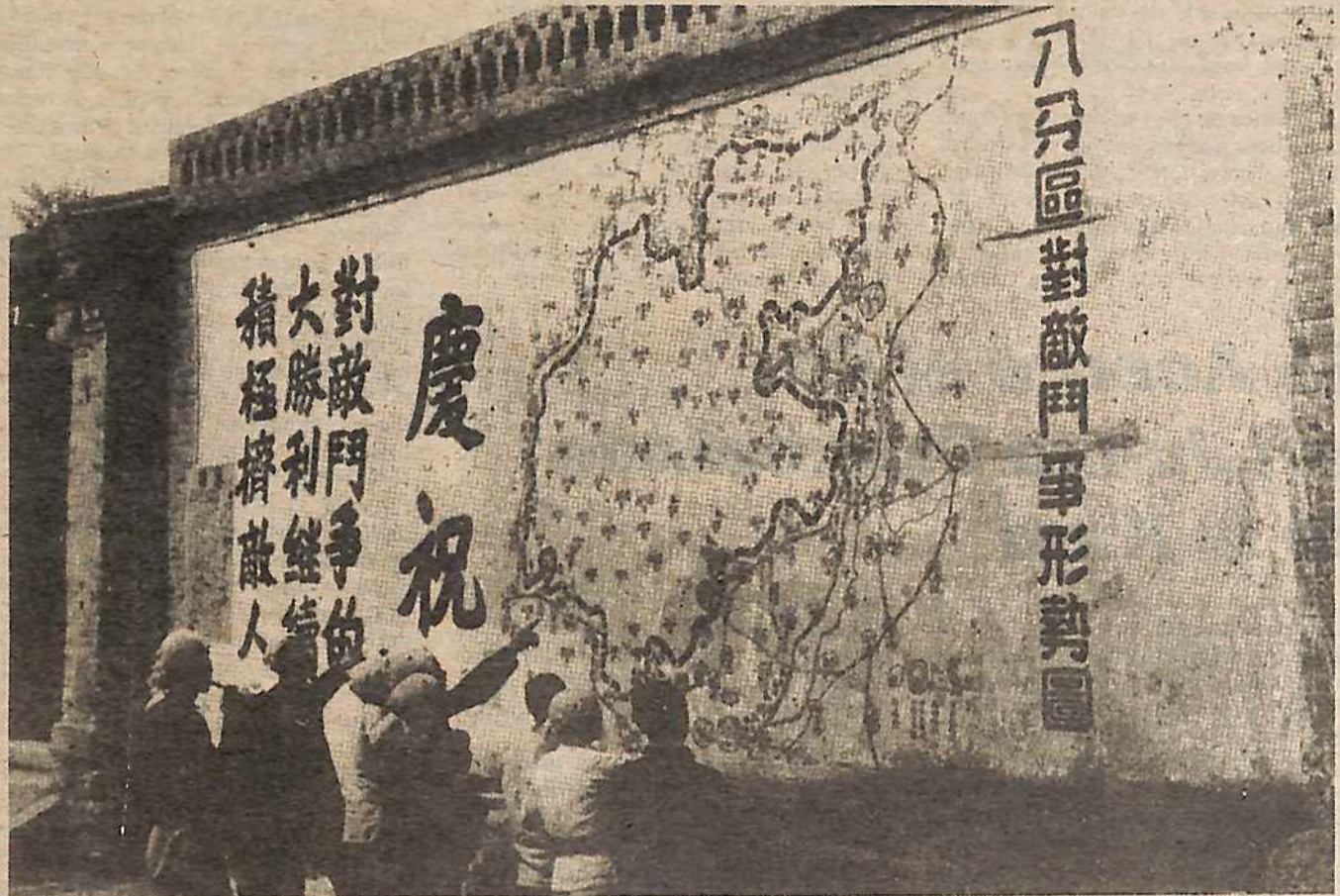
Arriba: Campesinos chinos estudian un mapa de la base de apoyo anti-japonesa Shansi-Suiyan durante la guerra contra el Japón.

En el mismo discurso, el Camarada Avkian acentuó la necesidad de aprender de la iniciativa de las masas para crear nuevas formas de transformar la sociedad y de impulsar la lucha: "¿Y de dónde piensan que salieron los Soviets en Rusia? No brotaron del