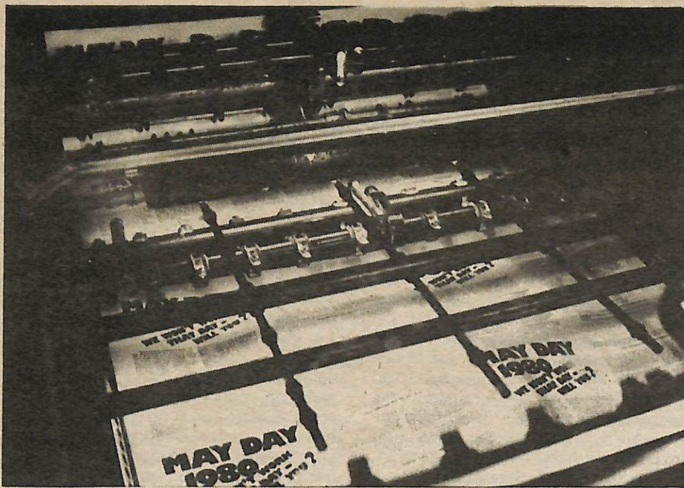
Los primeros volantes son impresos.

El guante ha sido arrojado. La llamada es pública. La primera amplia ofensiva en una campaña que culminará el Primero de Mayo.