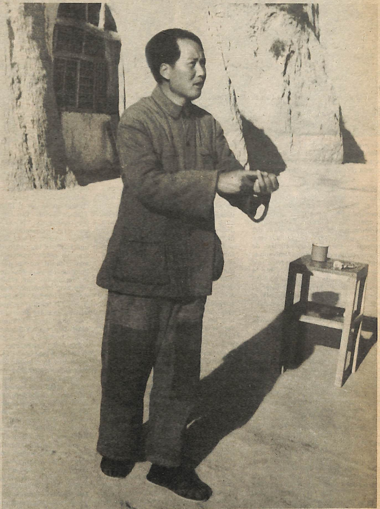
Mao Tsetung habla con cuadros en Yenan 1942.

El materialismo dialéctico también es fundamentalmente diferente en otro aspecto esencial—proclama