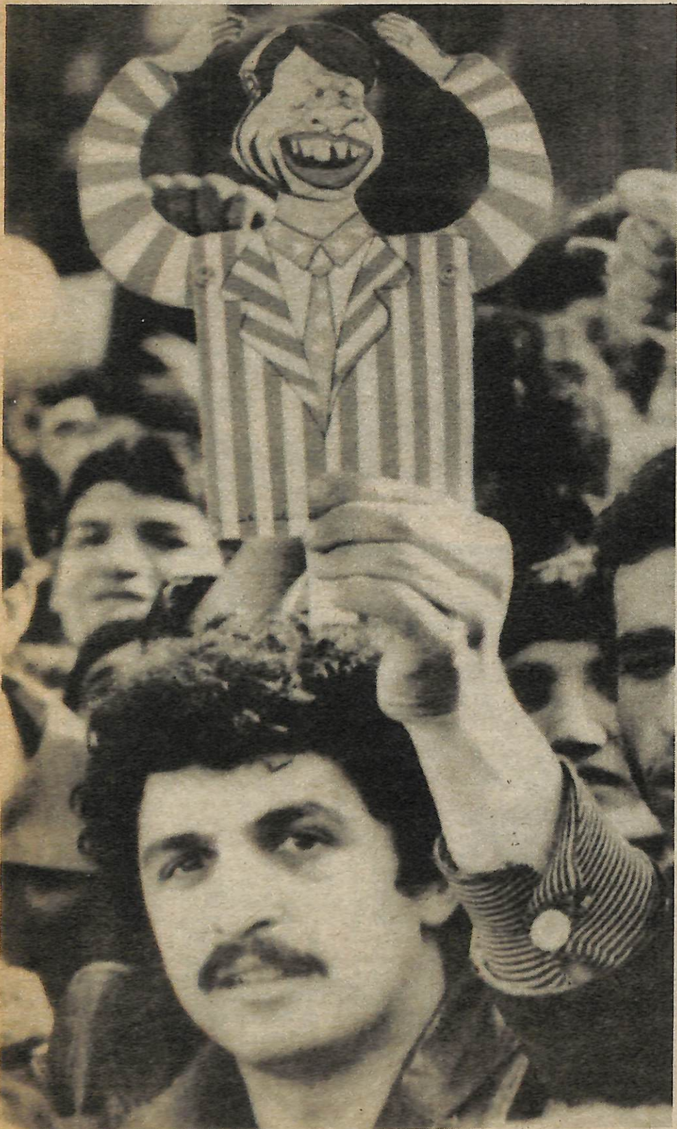
Un manifestante en Irán con un títere de Carter—cuando se le jala una cuerda las manos se dan contra la cabeza.

Esta manifestación tiene metas altas que cumplir y por seguro es capaz de cumplirlas. Y seguramente una de estas es la publicación en los diarios de todo el país, el lunes 28 de enero cartas enojadas de tontos reaccionarios que con desprecio exclamarán "Berkeley no ha cambiado nadita", posiblemente sugiriendo que si a los ciudadanos de esa ciudad no les gusta allí, sería mejor que "se vayan a Irán." Y millones de personas se reirán con leer esto, reconociendo que hemos comenzado a cambiar el rumbo de la corriente, que les hemos dado un golpe donde más lo sienten. ■