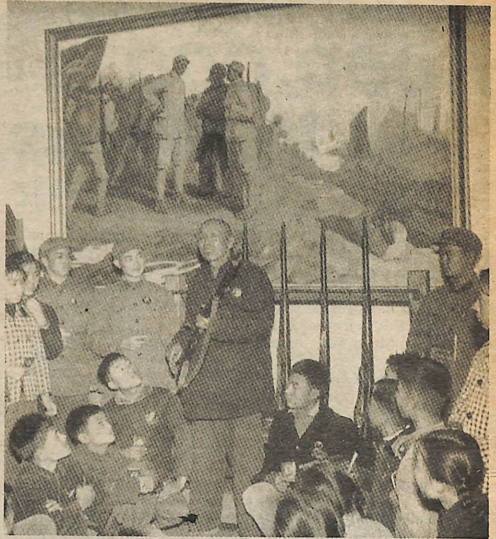
En 1927, miles y miles de obreros y campesinos fueron balaceados, decapitados y ferozmente torturados por las fuerzas de Chiang Kai-chek cuando éste traicionó la primera alianza con el Partido Comunista. Los masacres fueron concentrados en Shanghai y Wuhan. Aquí un obrero veterano de Wuhan cuenta de como, después del masacre en Shanghai, Liu Shao-chi ordenó a los obreros y campesinos a que entregaran sus armas; poco después, el masacre de Shanghai fue repetido en Wuhan.

Todo esto forma parte de los continuos ataques contra la línea de Mao, inclusive ataques contra la propia persona de Mao. Así que mientras que el "Jruschov de China" es hoy el "Camarada Liu", el Presidente Maó es disminuido a simplemente el Camarada Mao. La restitución de Liu es indispen-