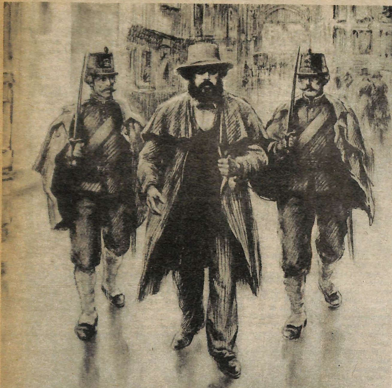
Se le arresta a Carlos Marx en Brussels durante el levantamiento revolucionario que barrió Europa en el 1848.