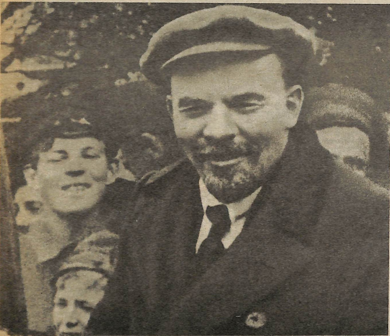
V.I. Lenin en la celebración del Primero de Mayo 1919.

desarrollo de las fuerzas productivas, que no es algo escogido por los hombres, sino que lo reciben en herencia de la generación previa y luego lo desarrollan. Por las fuerzas productivas se comprende productores con sus habilidades y conocimientos, así como sus instrumentos de producción y la tecnología, materias primas, etc. Las fuerzas productivas no sólo son la fundación básica de toda la sociedad, sino que también son su elemento más revolucionario. Puesto que la humanidad siempre desarrolla nueva técnica y aumenta la producción a un nivel siempre más alto, las fuerzas productivas cambian constantemente bajo la estructura de las relaciones de clase (conocidas como la base económica ) y las formas políticas e ideológicas (es decir la superestructura ) que se desprenden de esa base.