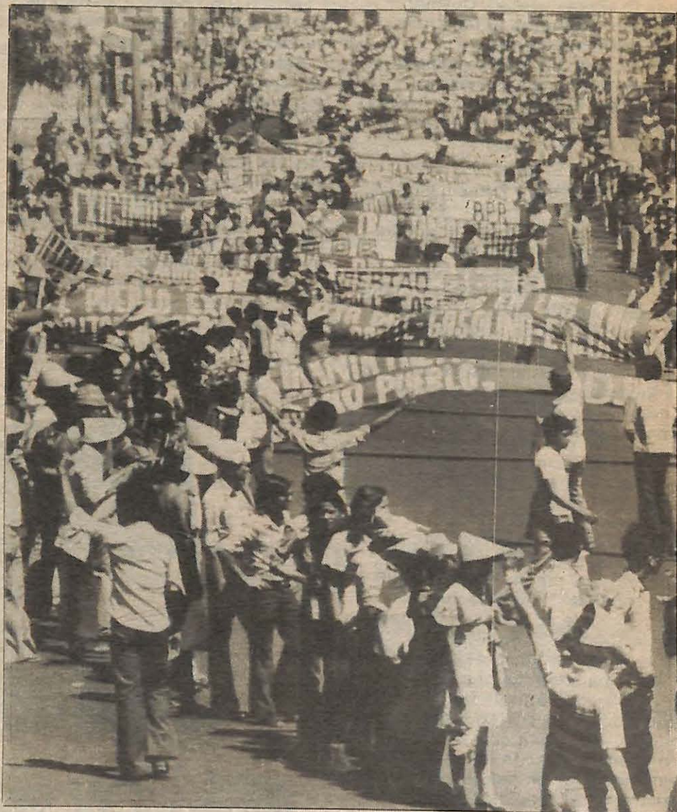
Miles de apoyantes del Bloque Popular Revolucionario marchan por las calles de San Salvador el 6 de noviembre en contra de la nueva junta militar respaldada por EEUU.

La situación actual tiene muy preocupado al imperialismo EEUU, porque teme que el próximo dominó en