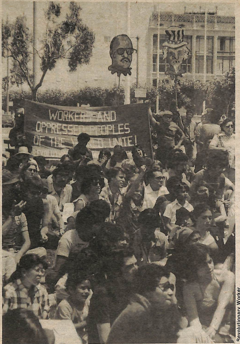
Manifestación antisomocista auspiciada por el FSLN en San Francisco, California el 14 de julio. La bandera del PCR EEUU dice: “¡Obreros y Pueblos Oprimidos del Mundo Unanse!”

Tal vez el arma más poderosa que por el momento tienen los EEUU y sus lacayos en América Latina es la de no dar ayuda económica a un nuevo régimen que no pregunte hasta dónde cuando los EEUU lo manda a que salte. Esto ya lo ha dicho los EEUU en muchas ocasiones. Un editorial en el periódico más grande del Brasil dijo: “¿Pueden los nicaragüenses por sí mismos reconstruir su economía? Claro que no. La situación en la que se en-