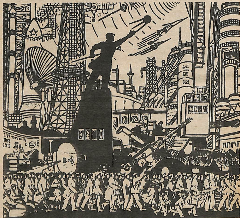
Un grabado en madera que muestra la propaganda de los gobernantes chinos: El sueño de un futuro con proyectiles, aviones jets, radares y artillería—todos modernos—y millones de obreros plácidos y anónimos que producen para los gobernantes.