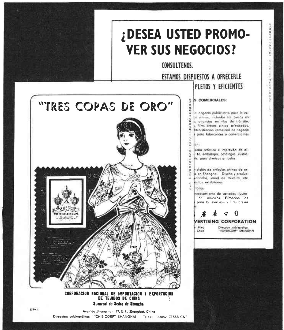
Portadas de atrás de números recientes de Beijing Informa .

Jua Kuofeng en su discurso en Tachai en el año 1975 llamó para la mecanización de la agricultura para el año 1980. El contenido de esta mecanización ha sido redefinido continuamente y al fin la meta en sí ha sido abandonada. Pero la línea política que ha guiado todo esto ha permanecido consistente, es decir, revisionista. El Informe del Comité Central del PCR sobre China hizo un análisis del discurso de Jua. Fue señalado que en ningún lugar trata con la cuestión central de reducir las diferencias entre los equipos de producción. Estas son diferencias económicas basadas en la fertilidad, la localidad del terreno, y la acumulación