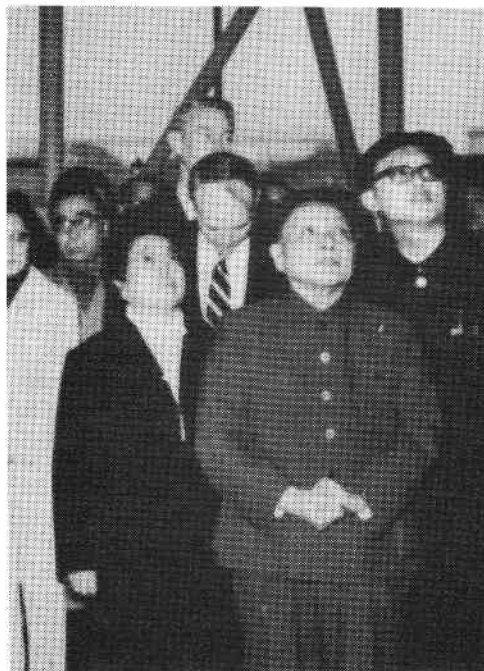
Teng Siao-ping rinde culto ante el santuario de la "modernización" imperialista.

Esta reunión del Comité Central es un conveniente punto de referencia, pues codificó temas que habían sido enfatizados en algunas