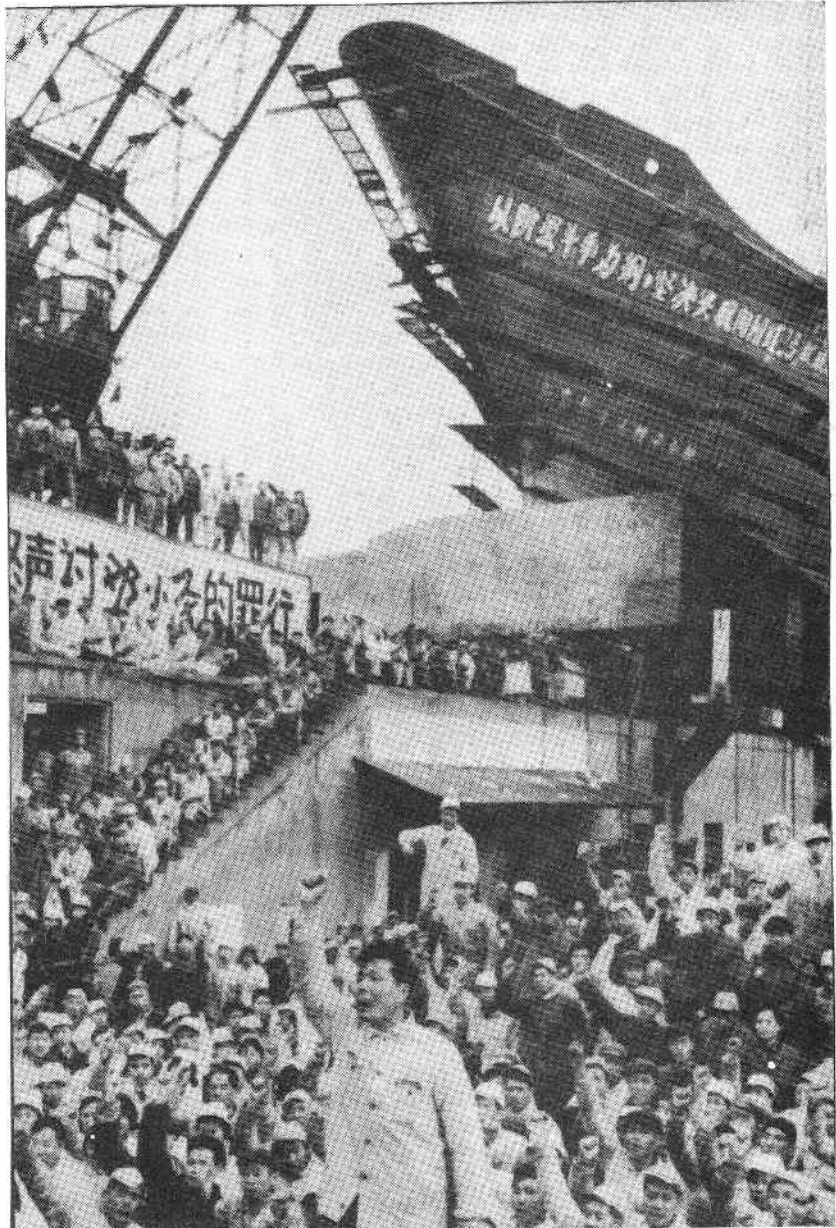
Hoy día en China Teng Siao-ping es un nuevo dominante burgués que chupa la sangre a la clase obrera. Cuando China era revolucionaria, los trabajadores lo denunciaron por sus crímenes, tal como se ve en este astillero de Shanghai.

El pasado semifeudal y semicolonial de China ha pesado muy duramente sobre ella, aún durante la etapa socialista de la revolución. Había las influencias ideológicas en forma de inferioridad nacional, el punto de vista de pequeños productores, la deferencia confuciana, y el hecho concreto que la revolución democrática no estaba tan distante ni separada de la revolución socialista. Dentro de cada etapa de la