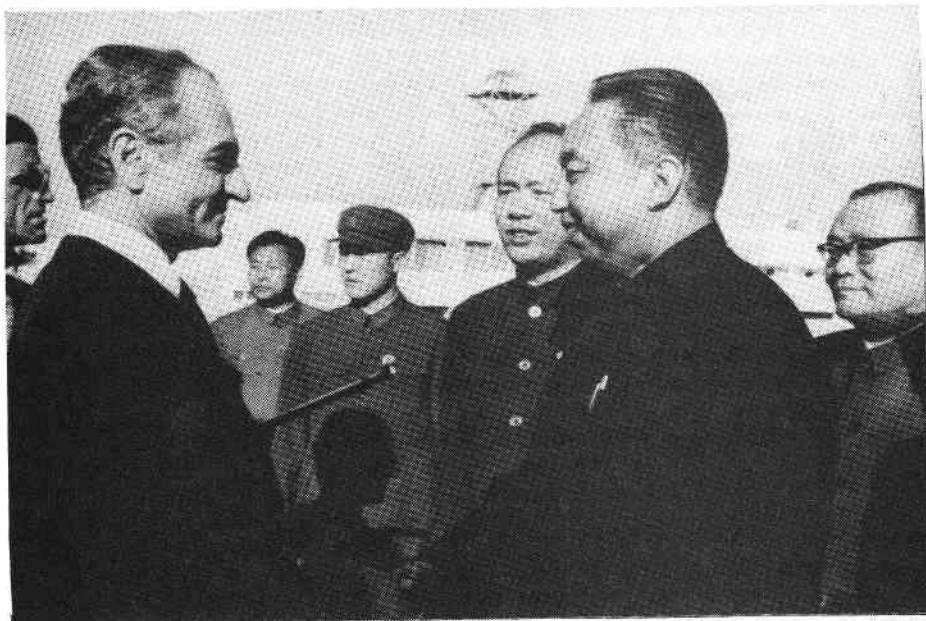
El hecho que las políticas "nuevas" de China no representan más que la reacción y la capitulación al imperialismo es ilustrado en forma gráfica por el abrazo que dio Jua al actual derrocado Sha de Irán.