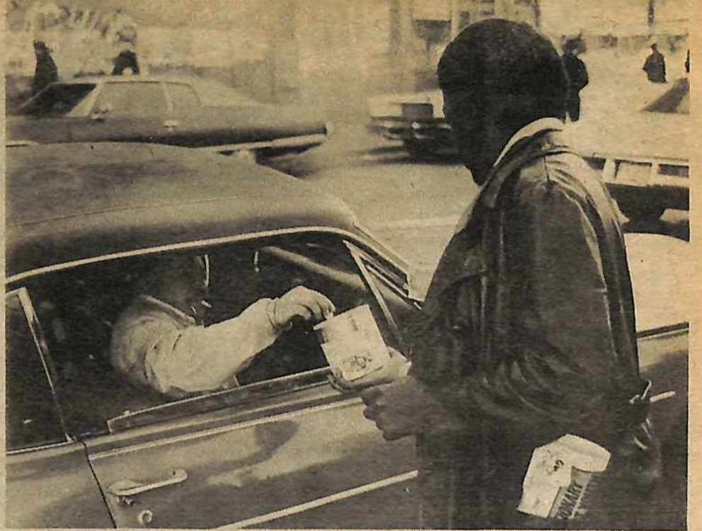
Además de las manifestaciones, se llevó a cabo muchas otras actividades en defensa de la Rebelión en Houston. Aquí un obrero de el área de Pilsen en Chicago hace una donación para apoyar a la defensa de los Tres de Moody Park.

Pero esta represión sólo ha servido a desplegar las llamas de la lucha, y a llenar a los militantes activistas con la determinación de prender el fuego con más intensidad. Gente Unida ha continuado piqueteando durante las se-