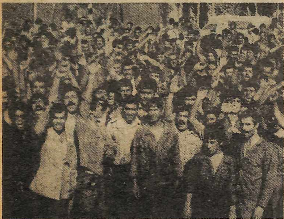
Manifestación durante una huelga por los obreros de la fábrica transformadora cerca de Teherán, el 3 de septiembre de 1978.

La lucha revolucionaria del pueblo iraní ha surgido por delante y alcanzado nuevas alturas durante estas últimas semanas. De un extremo al otro de Irán, millones de personas están tomando las calles, luchando contra el régimen demandando "¡Abajo con el Sha!". Un desarrollo de mucha impor-