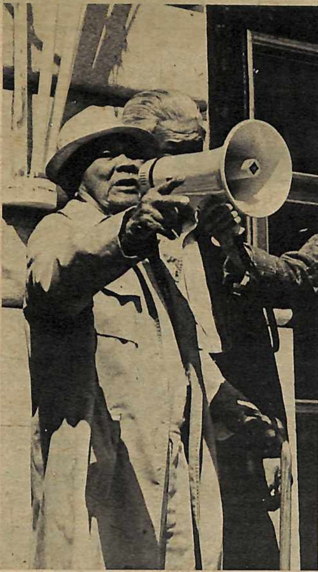
Los residentes ancianos del Hotel Internacional y los obreros veteranos que se reúnen a diario en el Centro Comunal Asiático tienen la experiencia de toda una vida de explotación y opresión. Apoyándose en su determinación firme a no mudarse y uniéndose con y avanzando la experiencia y el entendimiento de los más avanzados, se pudo movilizar apoyo de masas para la lucha y bloquear los intentos a desalojar a los residentes.

Luego de discutir la urgencia del juicio de desalojos, que iba a empezar en abril del 1976, todos vimos la necesidad de movilizar gente para asistir al juicio. La mayoría de los obreros e inquilinos, incluyendo a los relativamente avanzados, inicialmente tenían la ilusión de que podíamos ganarnos al jurado y ganar la decisión de la corte. Pero después de exponerse diariamente a esos procedimientos y resumirlos, la mayoría de los obreros se