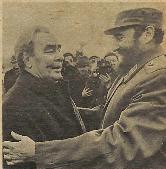
Fidel Castro abraza al patrón soviético Leonid Brezhnev de regreso del safari diplomático de Castro y el presidente soviético Podgorny quienes recurrieron el continente de Africa en abril. Fidel visitó a muchas capitales explicándole a los gobiernos como debieran de aprovecharse de la "ayuda" soviética para hacer frente al imperialismo de EEUU y desarrollar sus países dejados pobres y débiles por el colonialaje. Podgorny le siguió a Castro para alistar a los que quisieran aceptar su oferta. El ejemplo de la invasión mercenaria de Zaire dirigida por los soviéticos pone al desnudo el palo detrás de las palabras bonitas—muestra la verdadera cara agresiva del imperialismo soviético que va resuelto a agarrar a Africa por trampas y armas.

Desde entonces, Zaire (como se llamó bajo Mobutu) ha llegado a ser el gobierno negro pro-EEUU más impor-