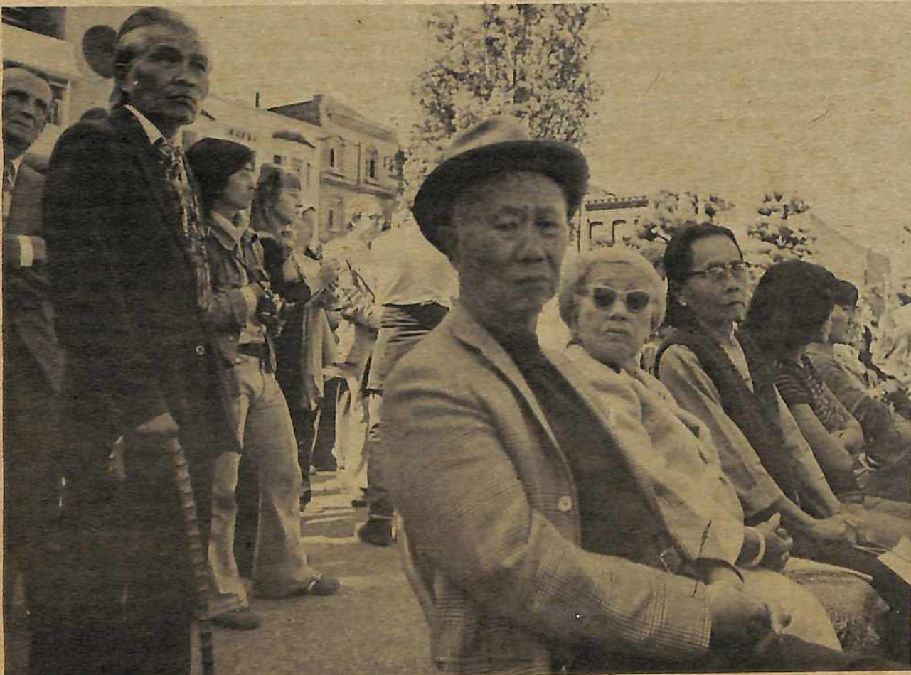
Estos hombres y mujeres han trabajado toda la vida produciendo ricos para la clase capitalista. Tienen largos años de odio a sus explotadores y muchísima experiencia de la lucha. La clave para movilizar contra el desalojo era unirse con estos sentimientos y enfocar su coraje contra los capitalistas y sus agentes.

Desde el punto de vista de si de veras avanza o no la lucha del pueblo de Zaire, Africa y todo el mundo contra el sistema imperialista que las dos superpotencias encabezan, esta invasión de Zaire es completamente reaccionaria y hay que oponerla totalmente. ■