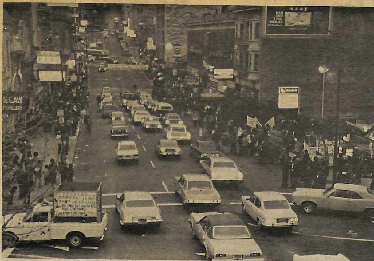
Parte de una manifestación de 2500 gente, una de un serie de manifestaciones de miles de gente que tomó lugar en enero y frustró los intentos de desalojar a los residentes.

Mao Tsetung dijo "...Si en un proceso hay varias contradicciones, necesariamente una de ellos es la principal, la que desempeña el papel dirigente y decisivo, mientras las demás ocupan una posición secundaria y subordinada." ("Sobre la Contradicción," Mao, Obras Completas , Tomo 1, página 355) Hasta este punto, nuestro análisis de la situación concreta era correcto—la orden de evicción era la contradicción principal, y nuestro punto de ataque principal era el sheriff y el alcalde—para acorralarlos para que no pudieran llevar a cabo las evicciones. El plan del alcalde fue un enfoque secundario.