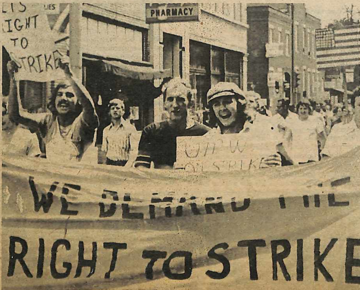
Mineros en huelga demandan el derecho a huelga.

EL COMITE DE MINEROS PARA DEFENDER EL DERECHO A HUELGA y EL COMITE MINEÑO EN PRO DEL DERECHO A HUELGA.