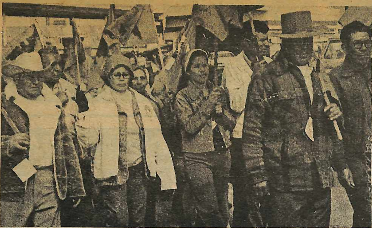
20,000 obreros campesinos y apoyantes marcharon en Modesto, California el 1 de marzo contra la compañía Gallo y para adelantar el boicoteo de uvas esquirolas.

Pero la lucha en los meses que vienen depende completamente de la fuerza y acción militante de los obreros campesinos. Las elecciones seguirán hasta el año próximo, pero estas son sólo la primera batalla de la nueva etapa de lucha. Aún cuando salgan victoriosas las elecciones sólo dan a los miembros de la unión el derecho legal de negociar con los rancheros para un contrato. Y como saben todos obreros en cualquier parte, los explotadores jamás van a ceder ningún cosita sin pelear. La lucha de los campesinos está muy lejos de terminar. Algunas de las batallas más duras están todavía para venir. ■