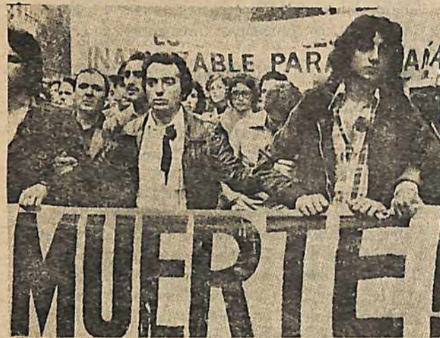
Había tremendas protestas a través de Europa después de las recientes ejecuciones que llevó a cabo el gobierno español. En el foto arriba, una marcha en Alemania. Abajo, una manifestación en Francia.