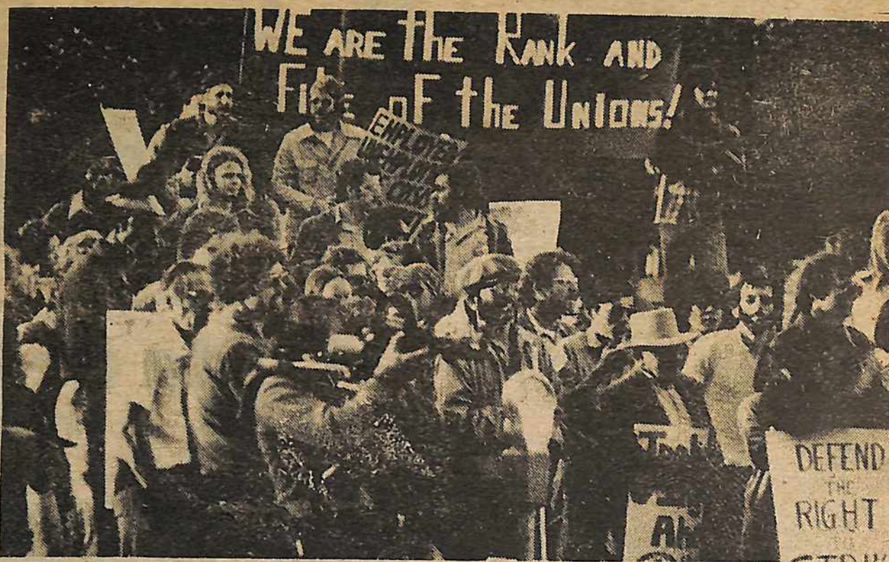
La manifestación de cientos de obreros afuera de la convención de la AFL-CIO el 3 de octubre llevó las demandas del movimiento creciente de obreros.