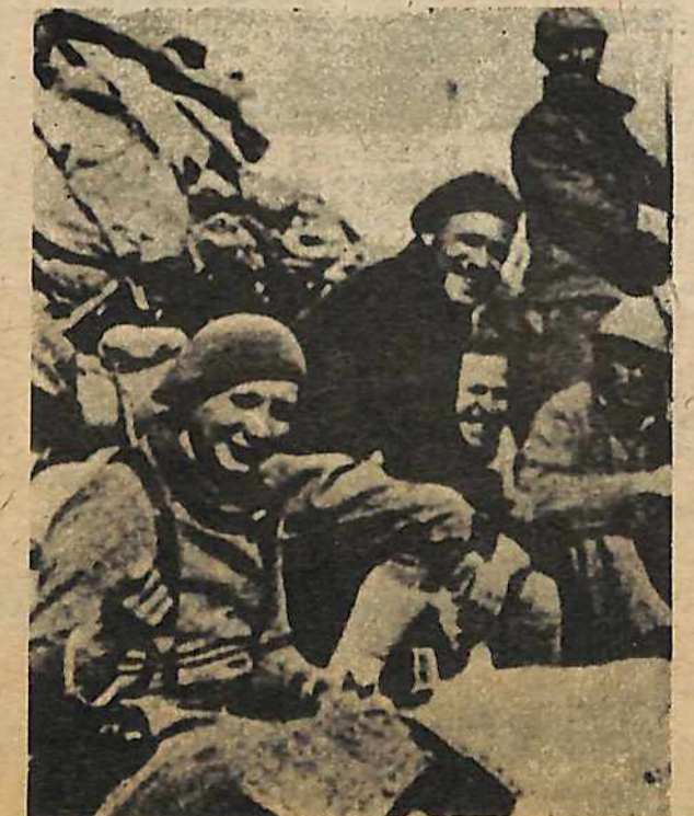
Obreros de todas partes del mundo combatieron junto con los obreros y el pueblo español en la guerra civil de 1936-39. Arriba, el contingente de EE.UU. de las Brigadas Internacionales.

En EE.UU.: seis meses, $2; al año, $4; al año por aéreo, $10. En Canada: al año, $6; por aéreo, $10. En otros países: al año, $6.50; por aéreo, $15. Precios comerciales obtenibles a librerías.