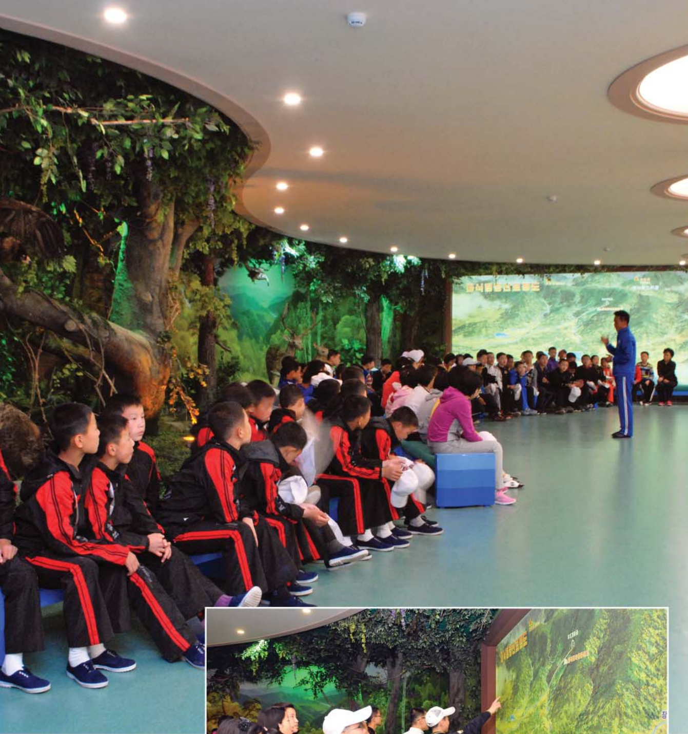
Education in mountaineering Приобретение знаний альпинизма.