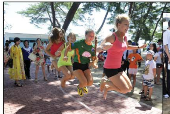
Folk games Фольклорная игра.