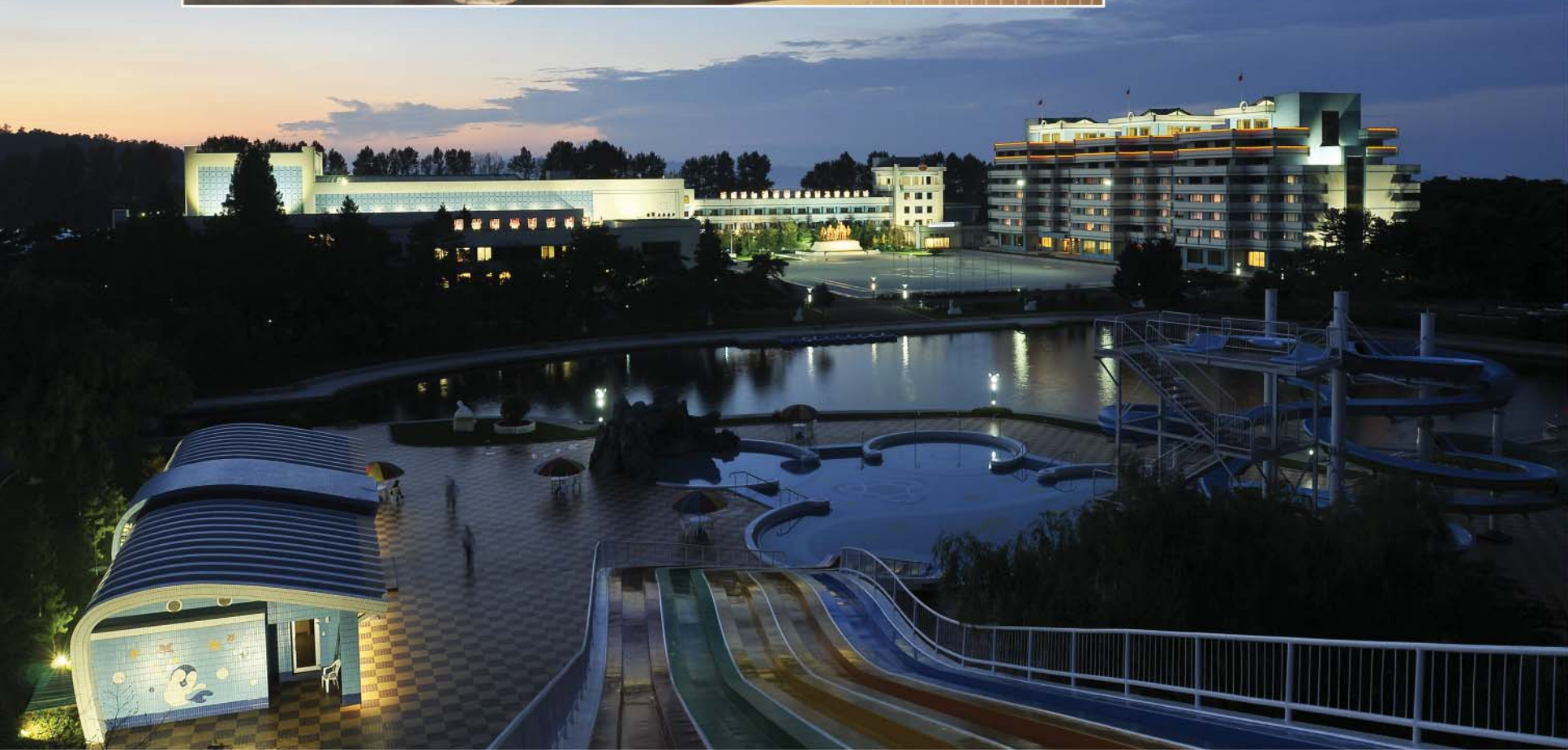
Для детей из разных стран предусмотрена экскурсия по городу Пхеньяну после веселых дней в Сондовонском международном детскоюзовском лагере.