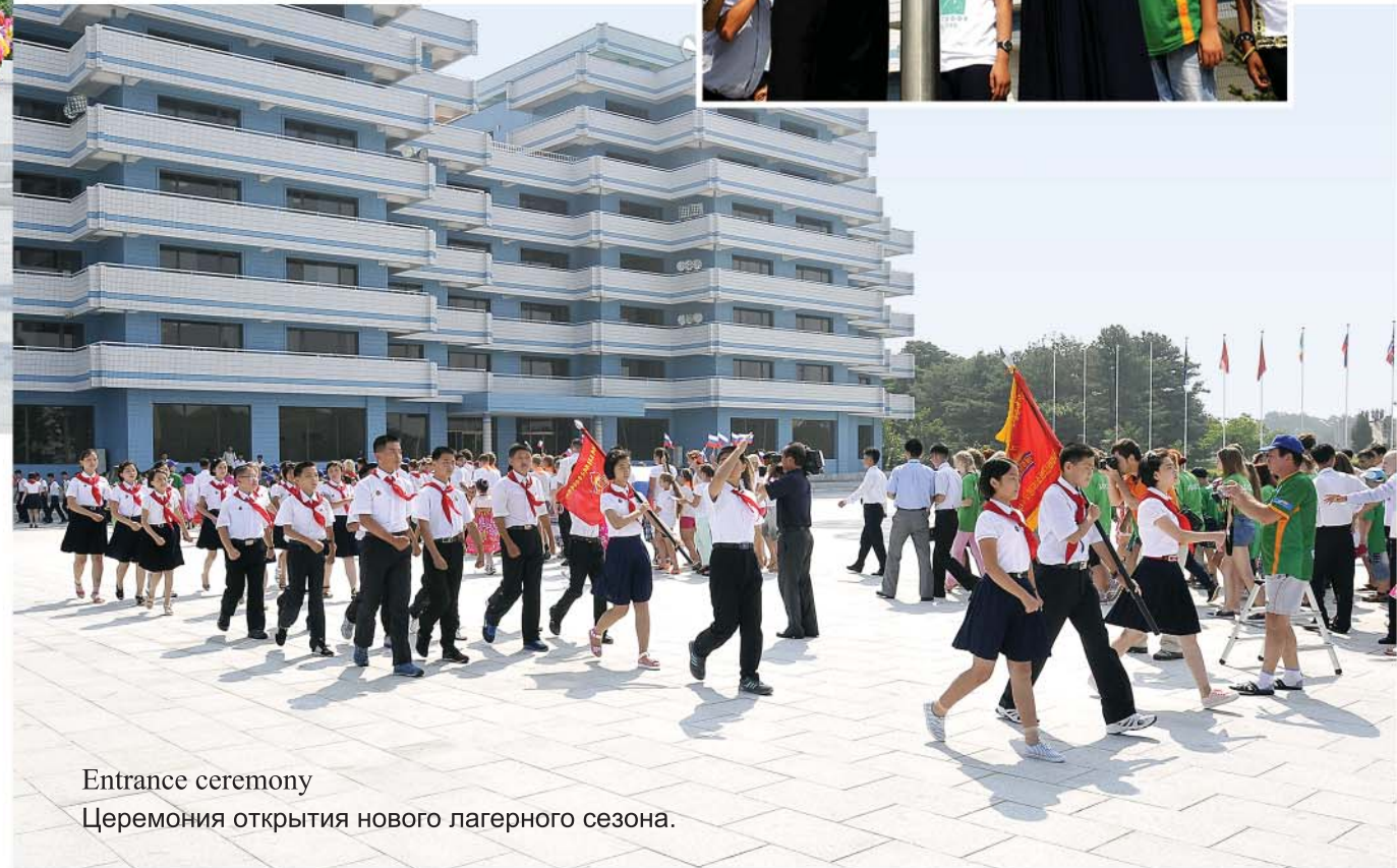
Entrance ceremony Церемония открытия нового лагерного сезона.