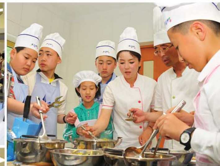
Cooking practice Кулинарная практика.