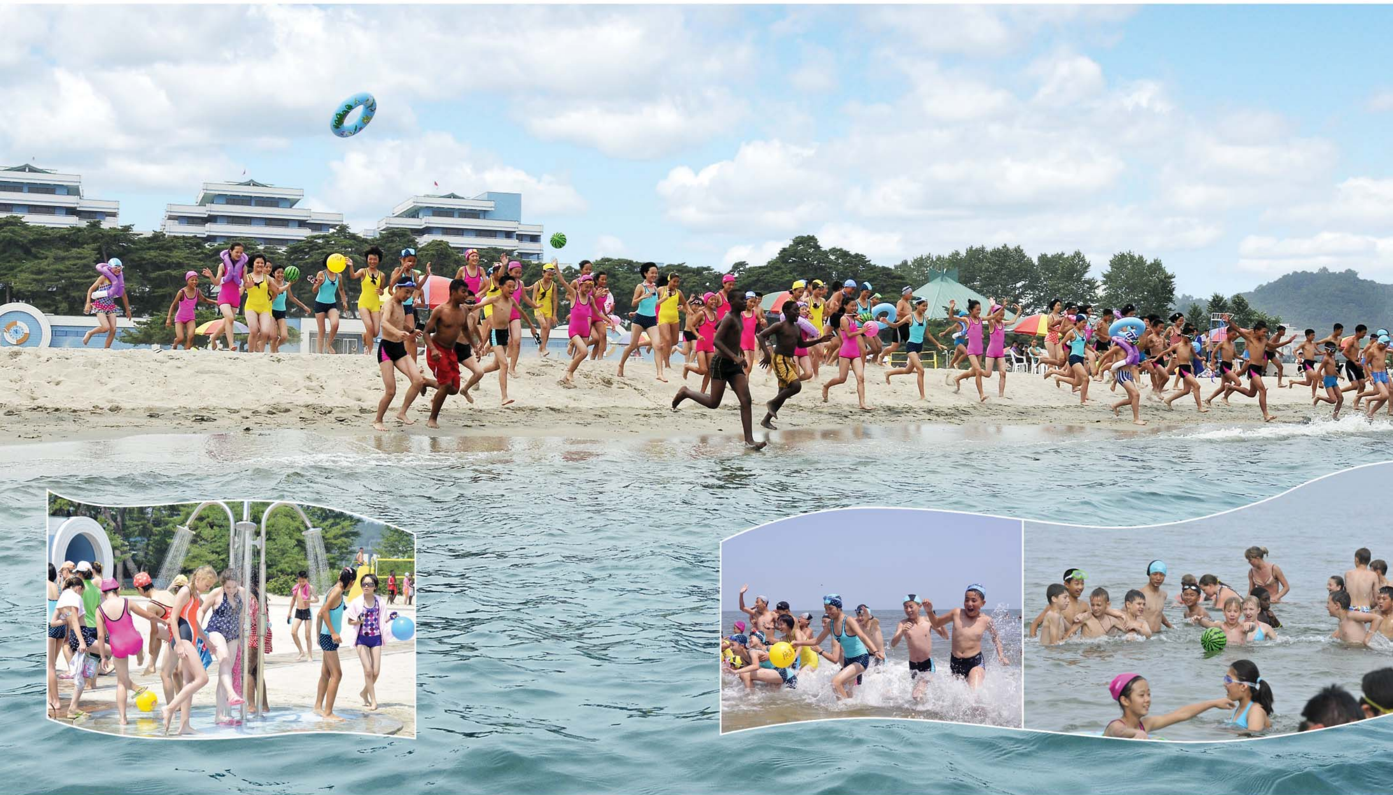
Bathing Морской пляж.