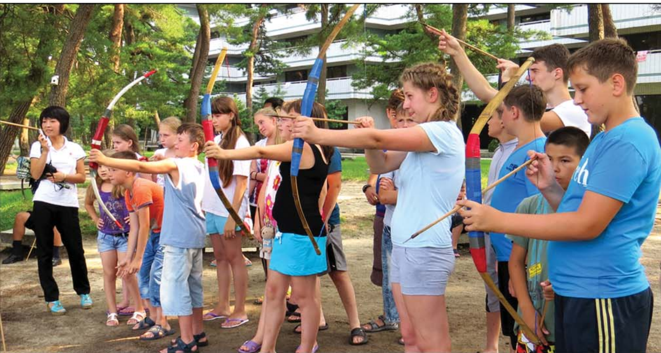
Archery Стрельба из лука.