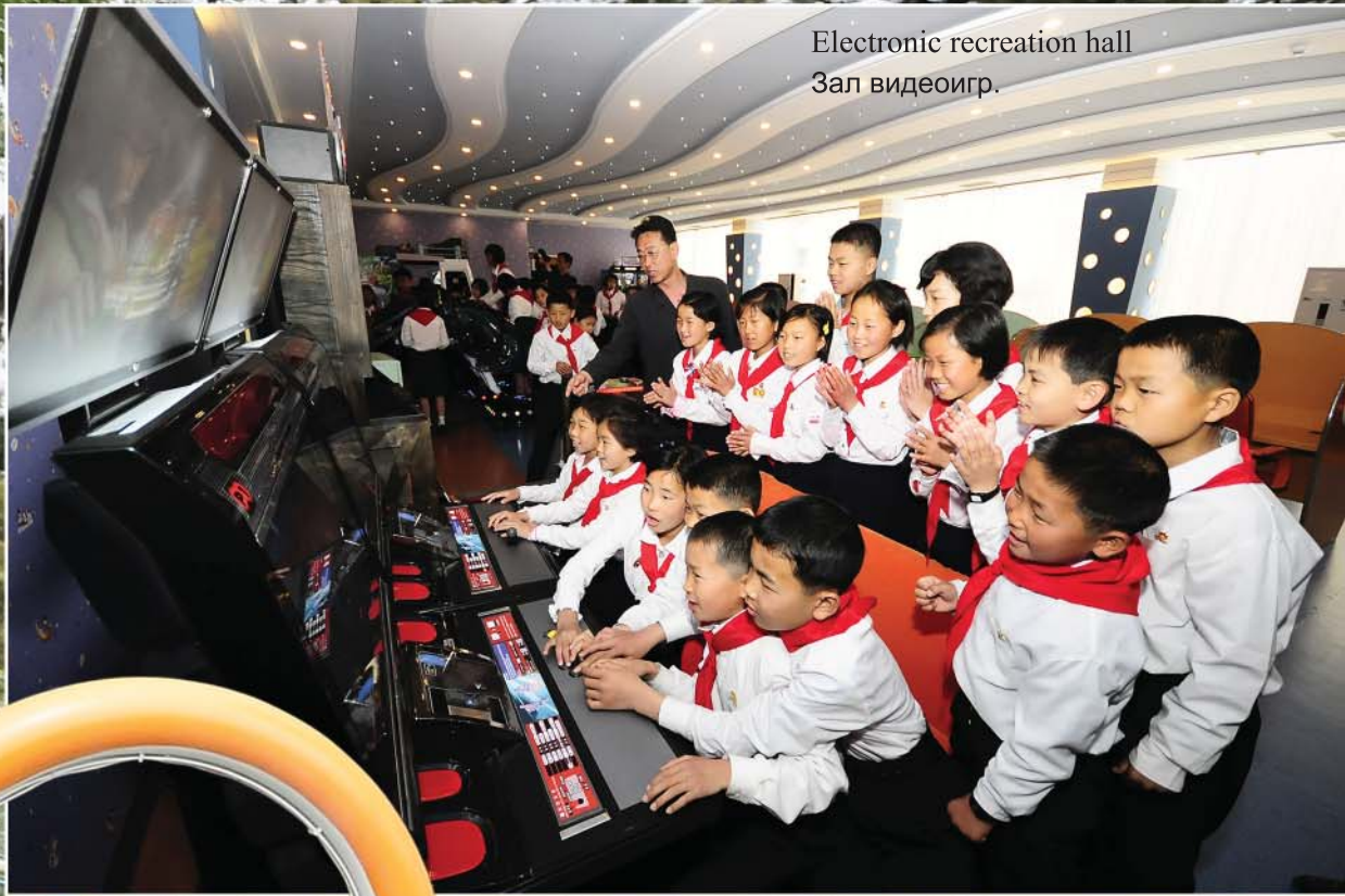
Electronic recreation hall Зал видеоигр.