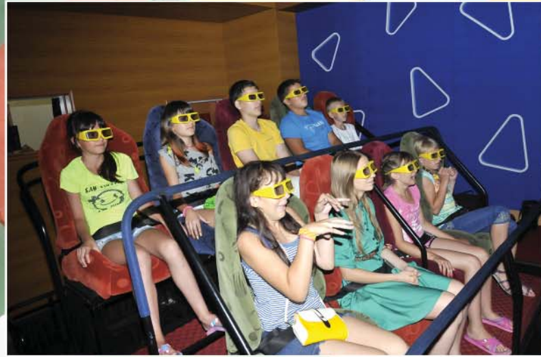
4D simulation cinema 4-D кинотеатр.