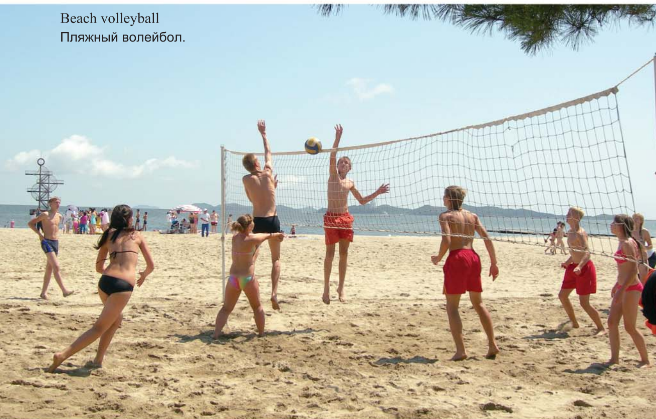
Beach volleyball Пляжный волейбол.