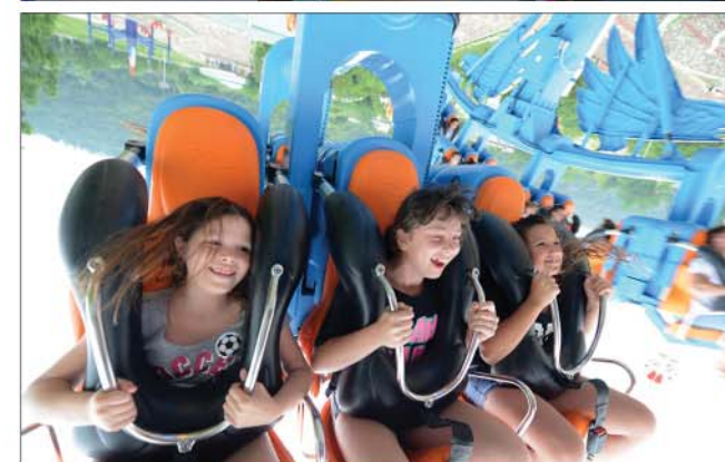
Foreign campers visit Pyongyang after enjoying merry camping at the Songdowon International Children's Camp