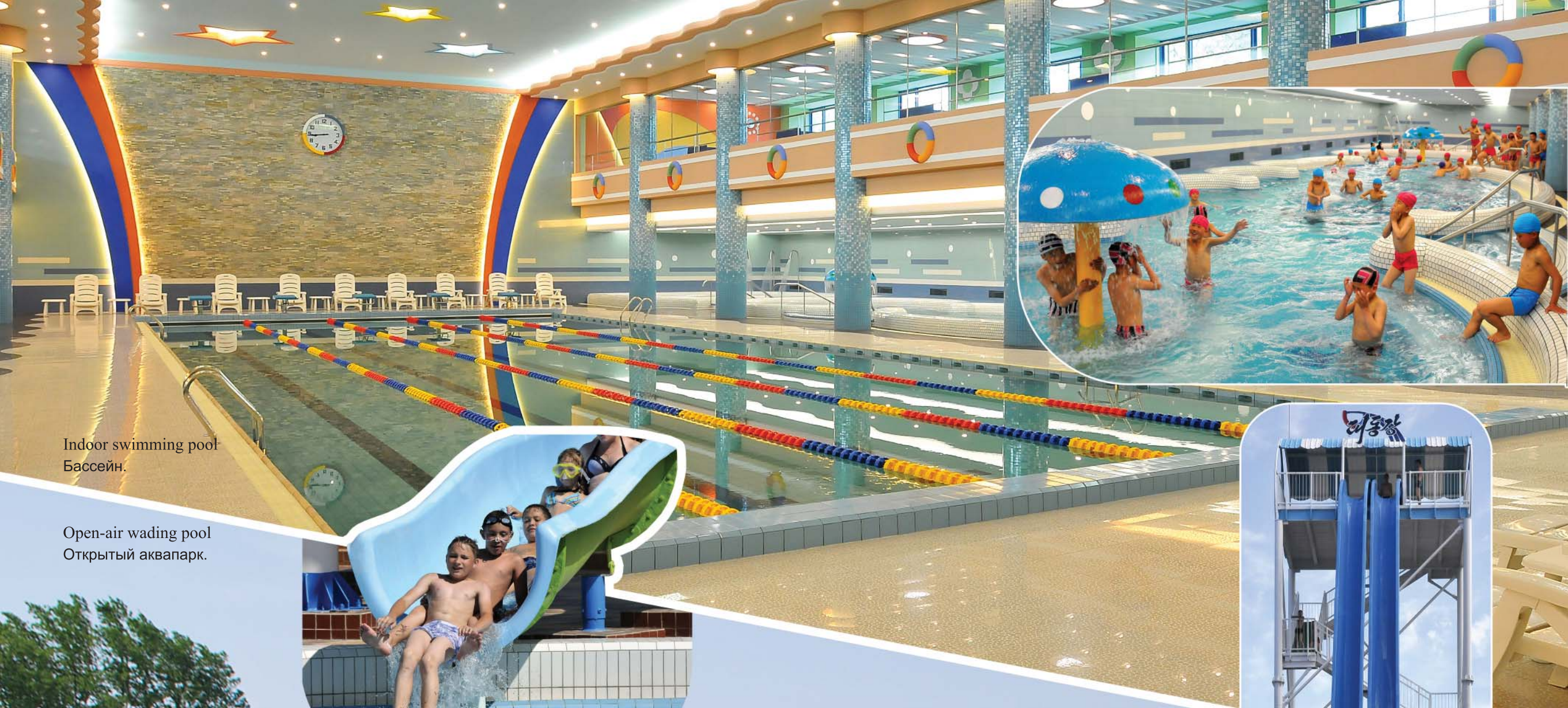
Indoor swimming pool Бассейн.