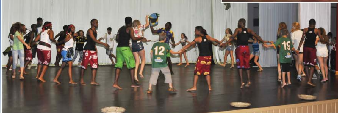
Night of friendship Ночь дружбы.