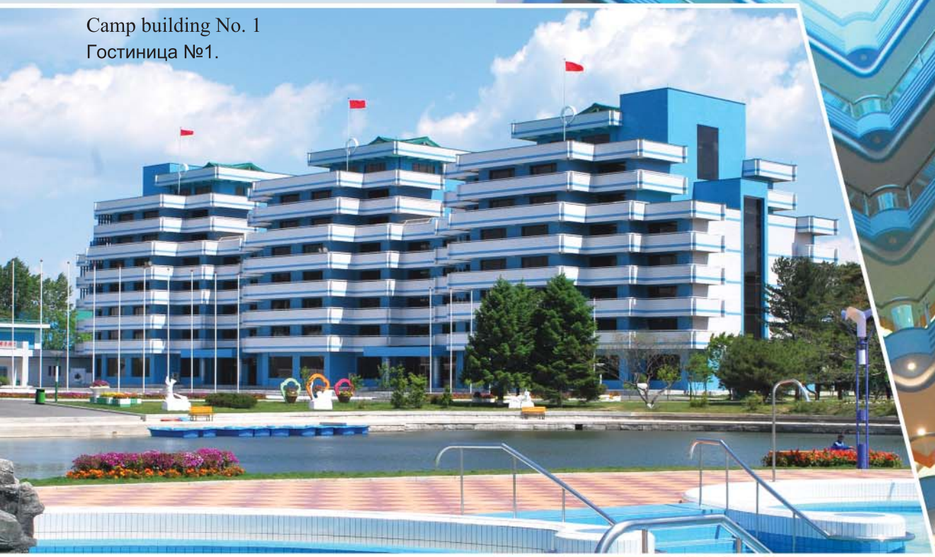
Camp building No. 1 Гостиница №1.