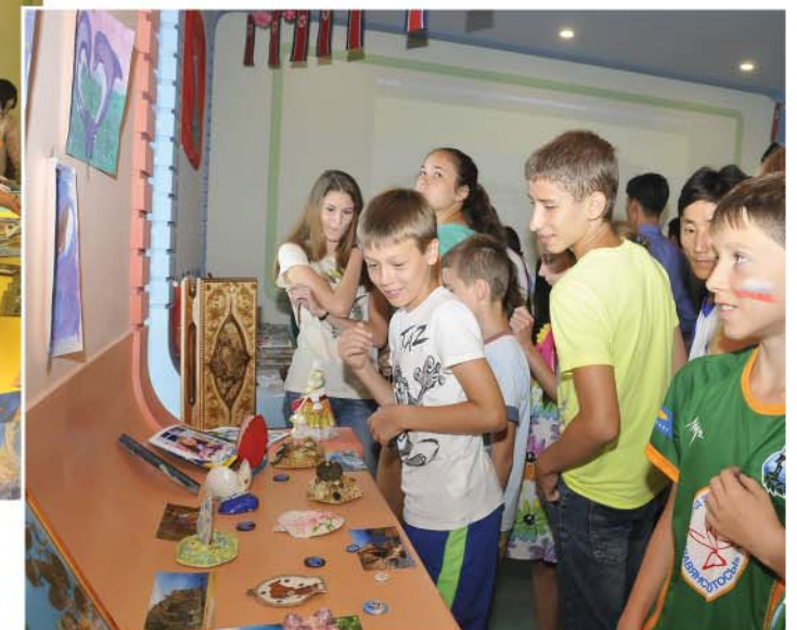
Day of Nations День наций.