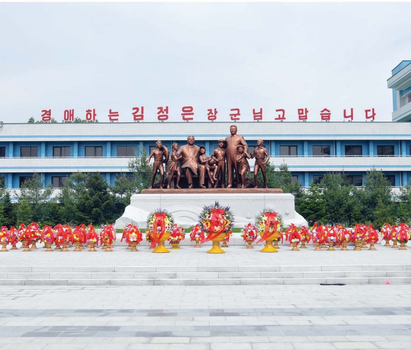
Bronze statues of great Generalissimos Kim Il Sung and Kim Jong Il Статуи великих Генералиссимусов Ким Ир Сена и Ким Чен Ира на территории Сондовонского международного детскоюзовского лагеря.