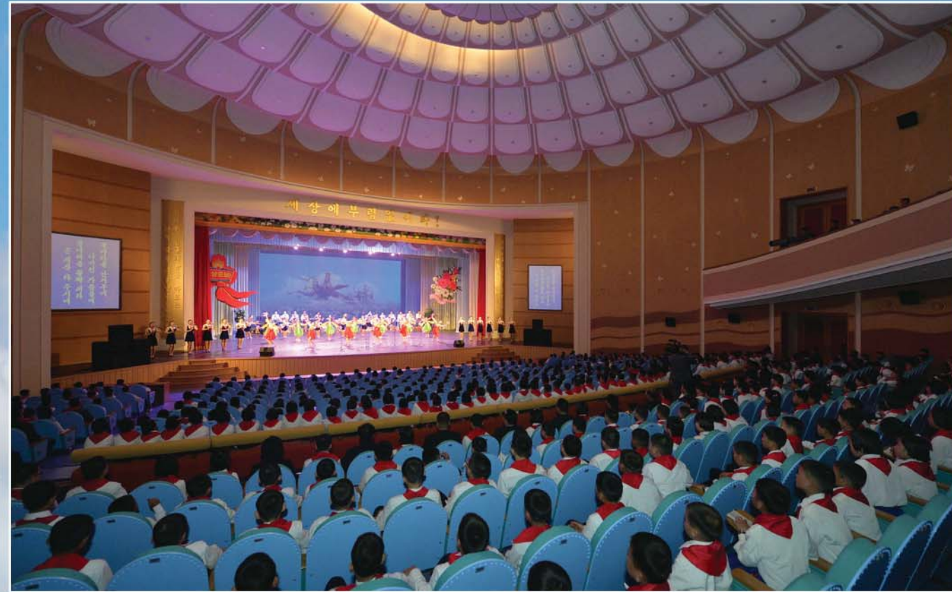
International Friendship Children's Hall Дом международной дружбы.