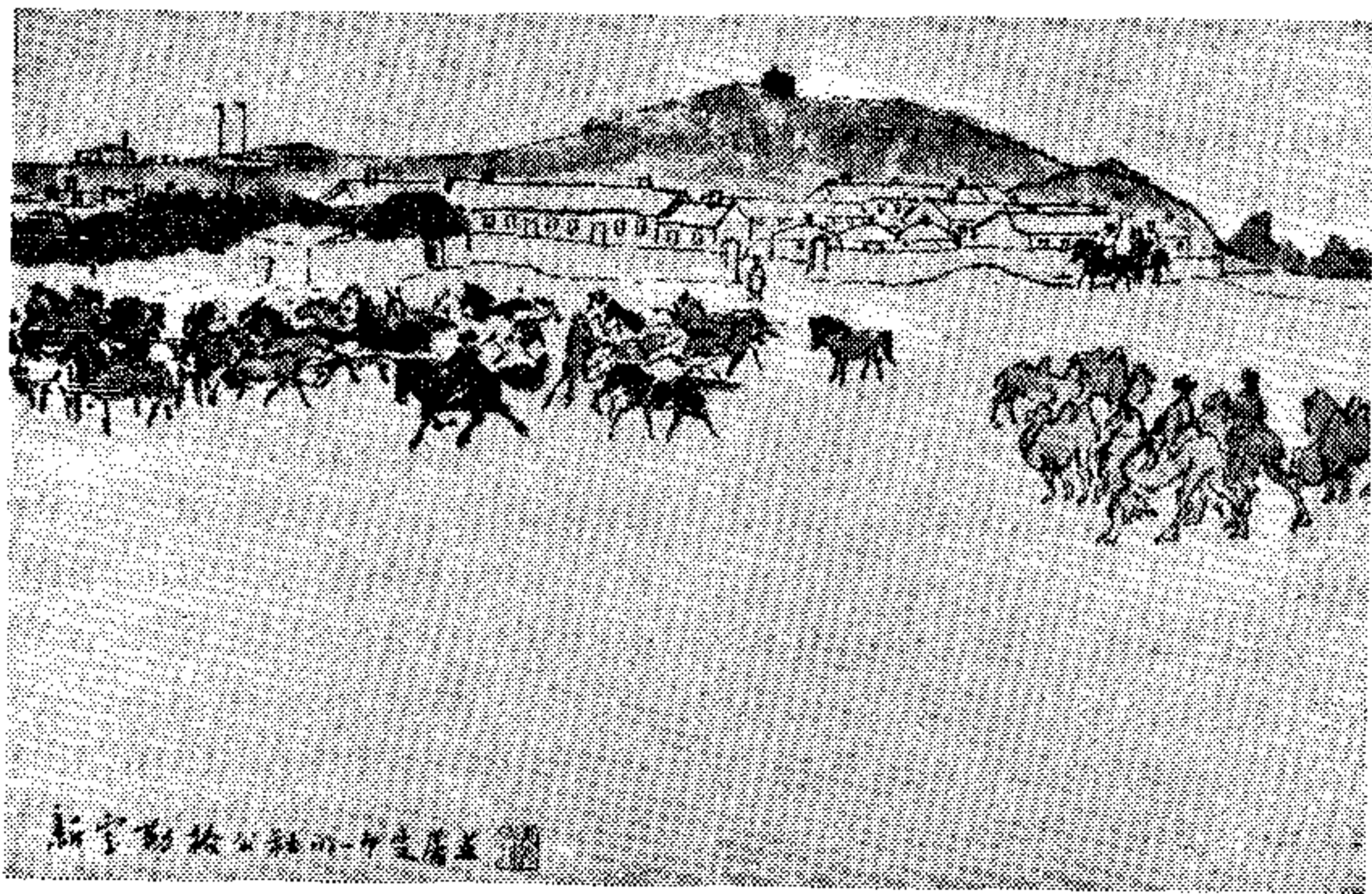
新宝勒格公社的一个定居点

的思想政治教育，使社员进一步认识国家利益、集体利益和个人利益的一致性，认识维护和发展国家利益和集体利益就是个人的最大利益。要使社员充分地了解，努力发展集体经济是增加家庭收入和改善生活的根本保证，使社员更加关心和更加积极地参加集体生产，自觉地遵守国家的政策、法令和集体劳动的纪律。只要这样，我们就可以在积极发展集体经济的前提下，使社员家庭副业和自留地的生产沿着正确的道路发展，很好地发挥它对社会主义经济的必要的补充和助手作用。